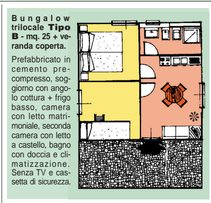
Bungalow trilocale Tipo B - mq. 25 + veranda coperta.

Prefabbricato in cemento precompresso, soggiorno con angolo cottura + frigo basso, nel soggiorno una rientranza senza porta con letto singolo, camera con letto matrimoniale, bagno con doccia e climatizzazione. Senza TV e cassetta di sicurezza.