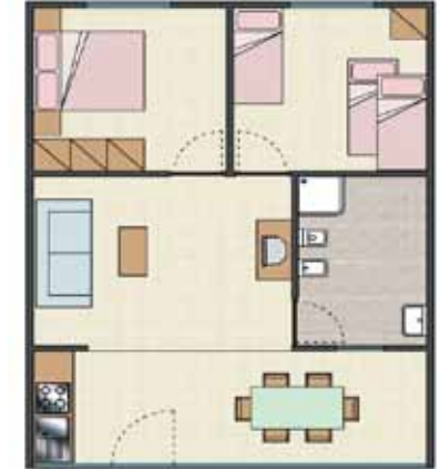
BUNGALOW - Maxi 6 P. - 48 mq.