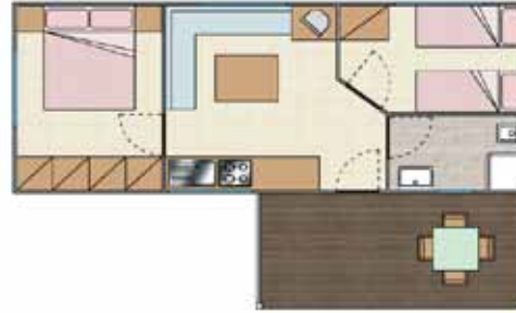
COTTAGE Family 4P. - 24 + 10 mq.