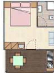
COTTAGE Couple 2 P. - 14 + 9 mq.