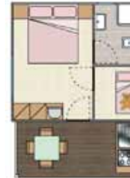
COTTAGE Couple 2 P. + 1 BABY (0-5 anni) 14 + 9 mq.