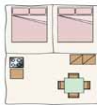
TENDA 4 P.