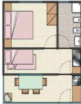
BUNGALOW - Smart 4 P. - 28 mq.