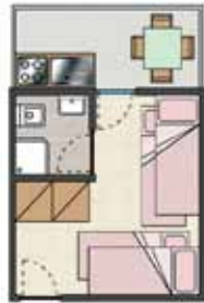
CAMERA Ostello 3/4 P. - 15 mq.