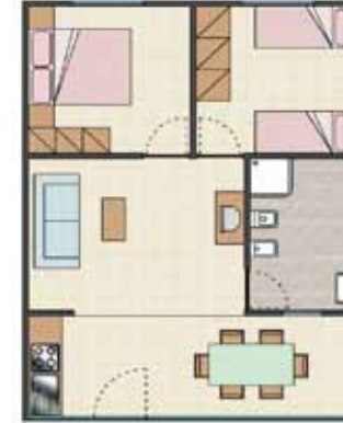
BUNGALOW - Comfort 5 P. - 33mq.