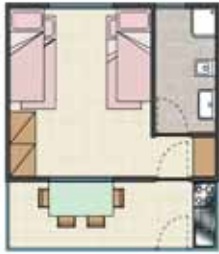
Mini - BUNGALOW 4 P. - 20 mq.