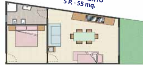
APPARTAMENTO 5 P. - 55 mq.