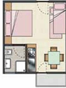
Mini - APPARTAMENTO 4 P. - 25 mq.